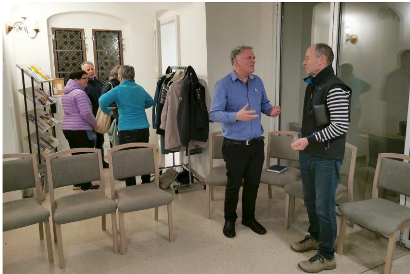
Bilder und Bericht: Bernd Ulbricht