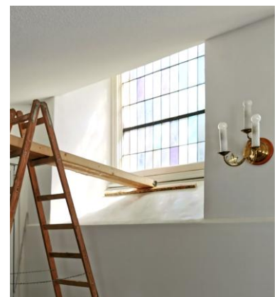
(Einbau der Fensterisolation hinten.)

Zum nächsten Treffen des Baudenkteams sind alle an diesem Thema Interessierten eingeladen, noch einmal über das Für und Wider zu sprechen.